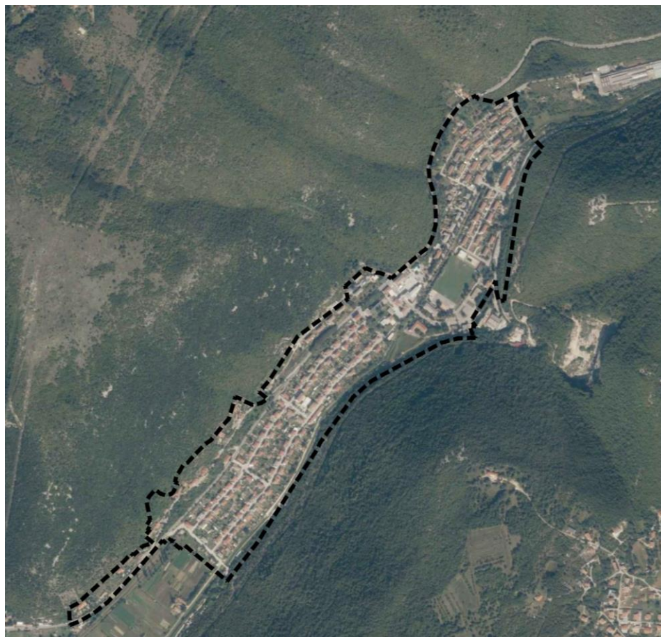
Područje obuhvata UPU Raša prikazano na DOF-u